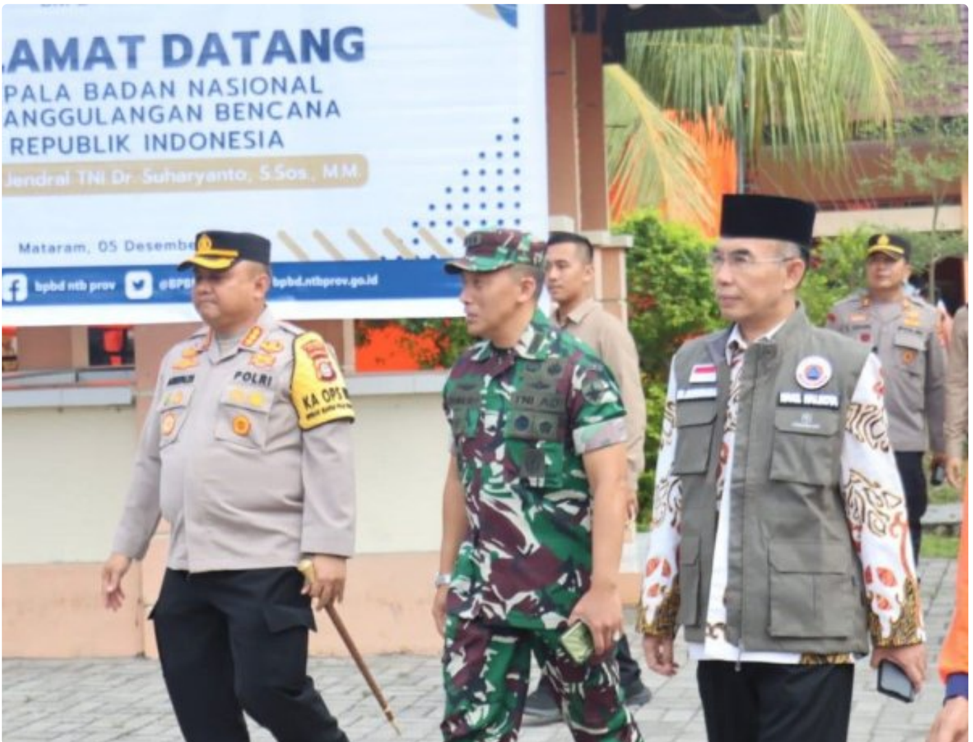
Kapolresta Mataram (Kiri) saat menghadiri acara Peletakan batu Pertama pembangunan gedung Pusdalops BPBD NTB, Kamis (05/12/2024)