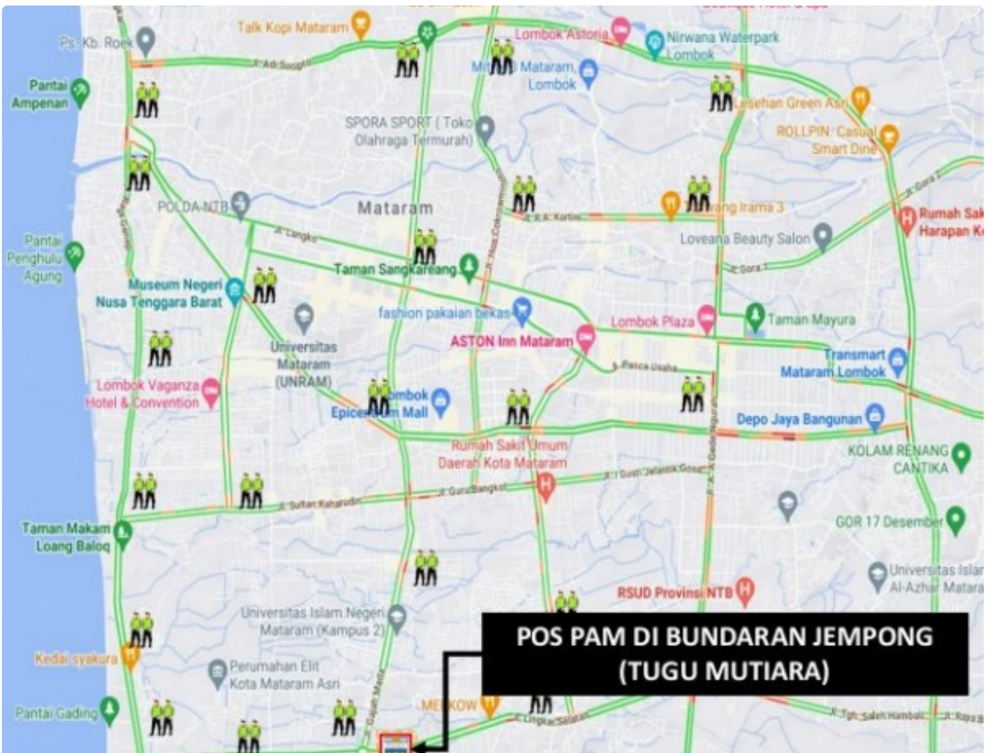
Personel yang Disiagakan pada Pos Pengamanan dan Pos Penyekatan, (04/11)

Mataram NTB - Mendukung terselenggaranya event Internasional Word Superbike (WSBK) Mandalika 2022 berlangsung sukses, ribuan personel akan disiagakan di dalam wilayah pulau Lombok, untuk itu para penonton tidak perlu